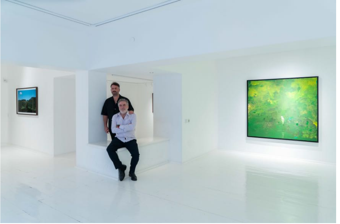
Galeri Siyah Beyaz, 2024