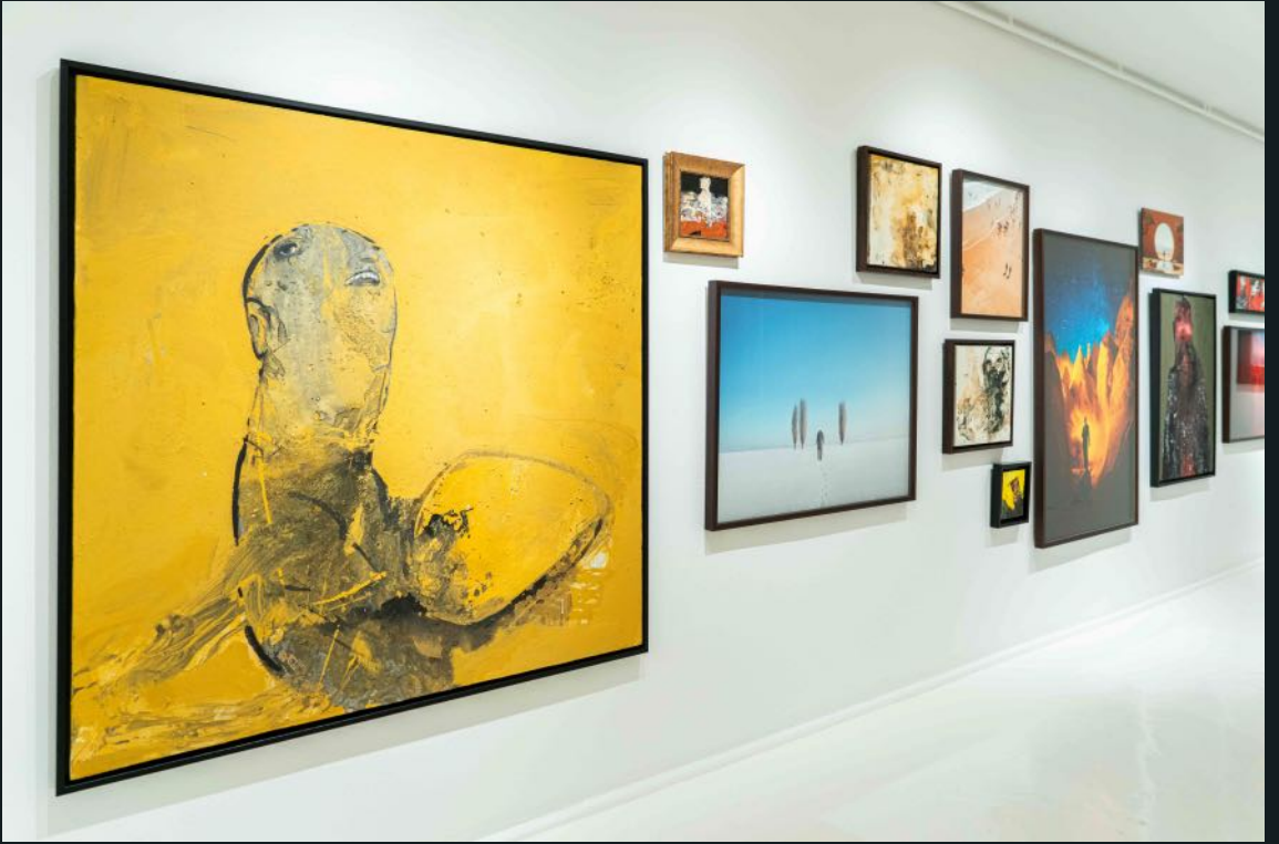
Galeri Siyah Beyaz, 2024 Bunu Siz Yaptınız You Did This