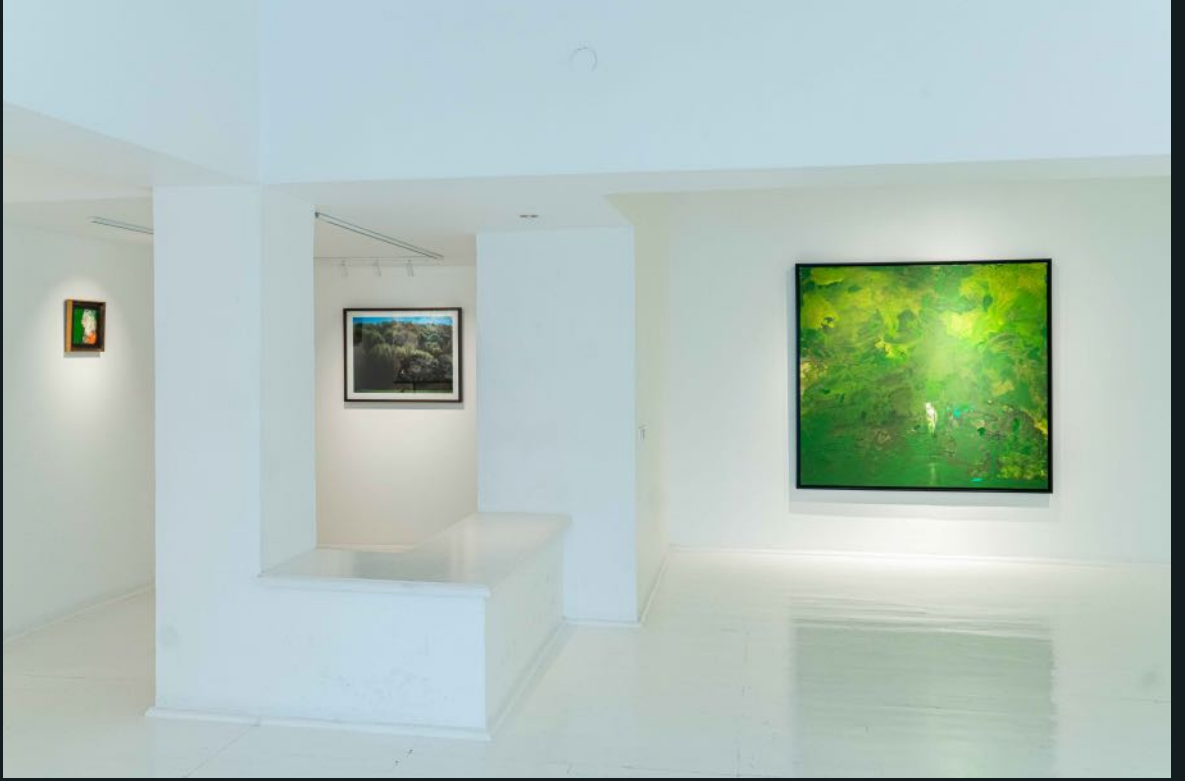
Galeri Siyah Beyaz, 2024 Bunu Siz Yaptınız You Did This