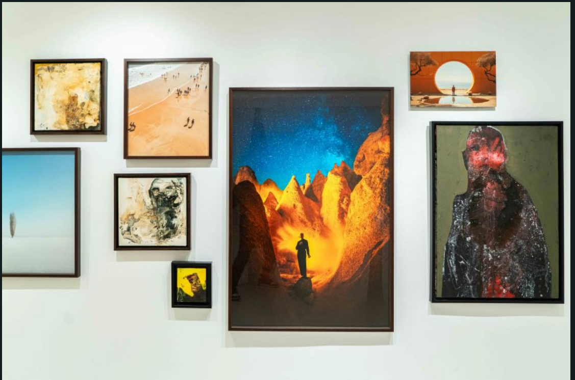
Galeri Siyah Beyaz, 2024 Bunu Siz Yaptınız You Did This