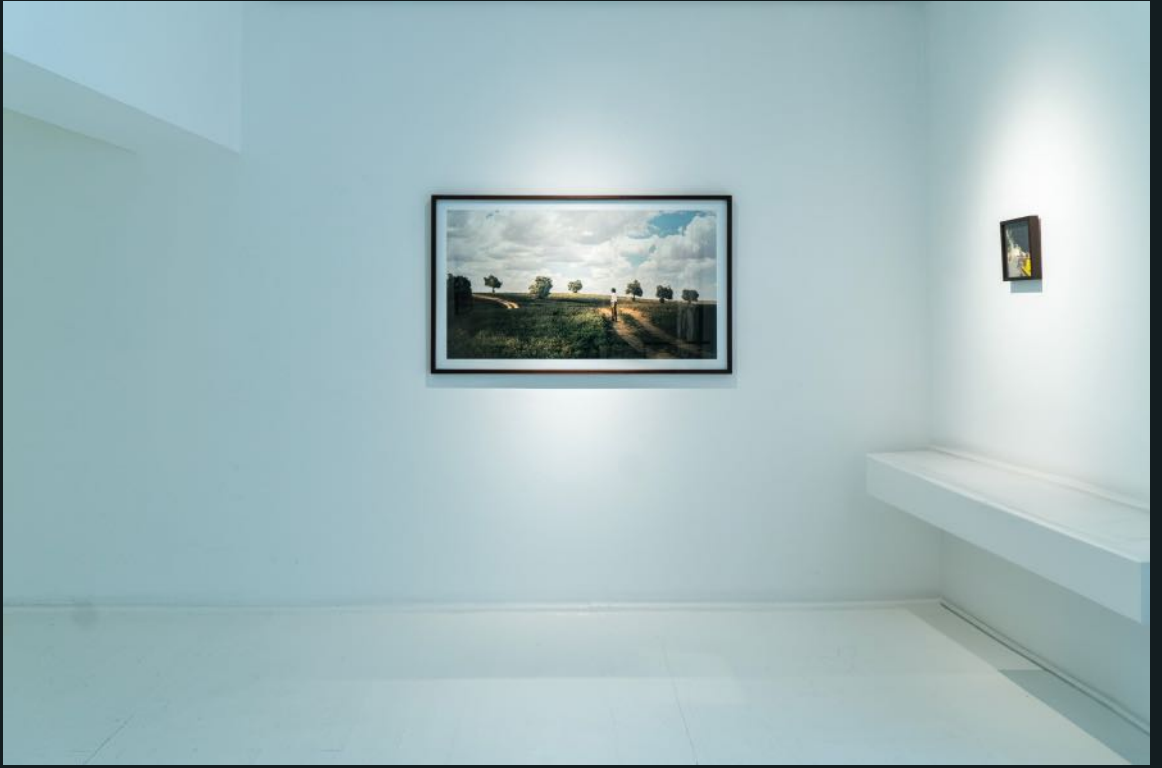
Galeri Siyah Beyaz, 2024 Bunu Siz Yaptınız You Did This