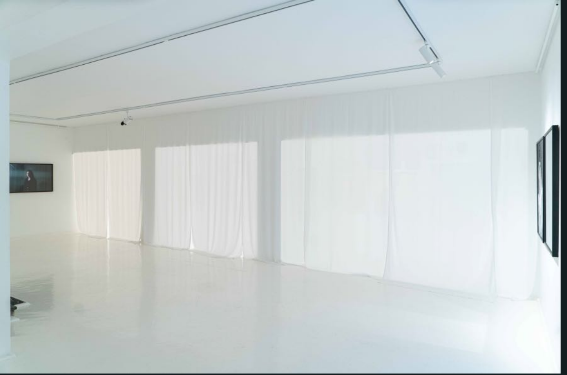
Galeri Siyah Beyaz, 2024 Bunu Siz Yaptınız You Did This