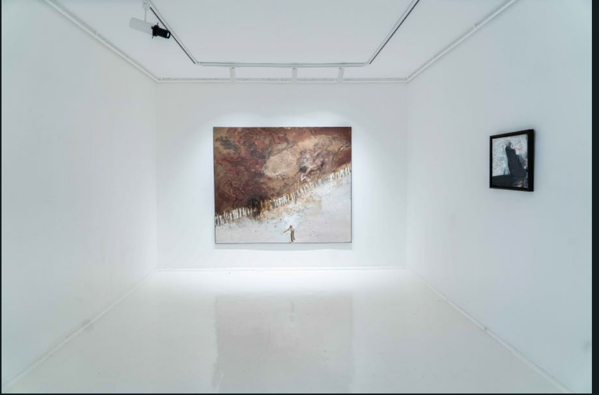
Galeri Siyah Beyaz, 2024 Bunu Siz Yaptınız You Did This