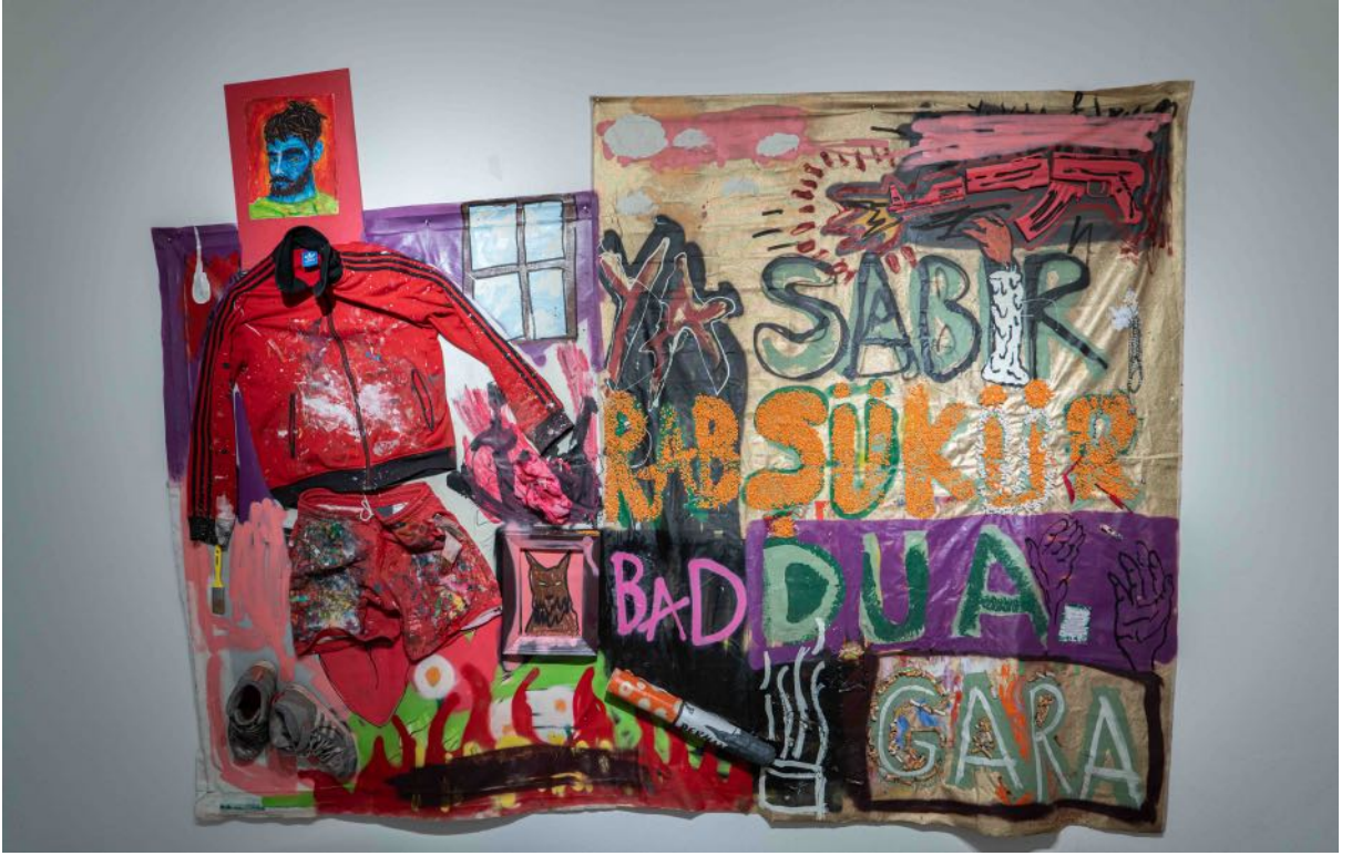
Bu oyun nerede başlıyor, nerede bitiyor?, 2024 kanvas üzerine karışık teknik, kolaj mixed media on canvas, collage 190 x 250 cm