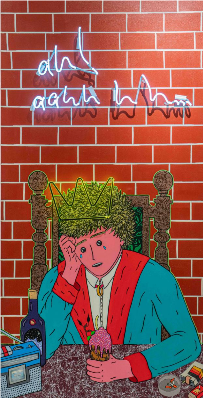
Bitik Prens ve Ah, 2024 kanvas üzerine akrilik, sarı ve beyaz neon ışık acrylic on canvas, yellow and white neon 174 x 89 x 7 cm