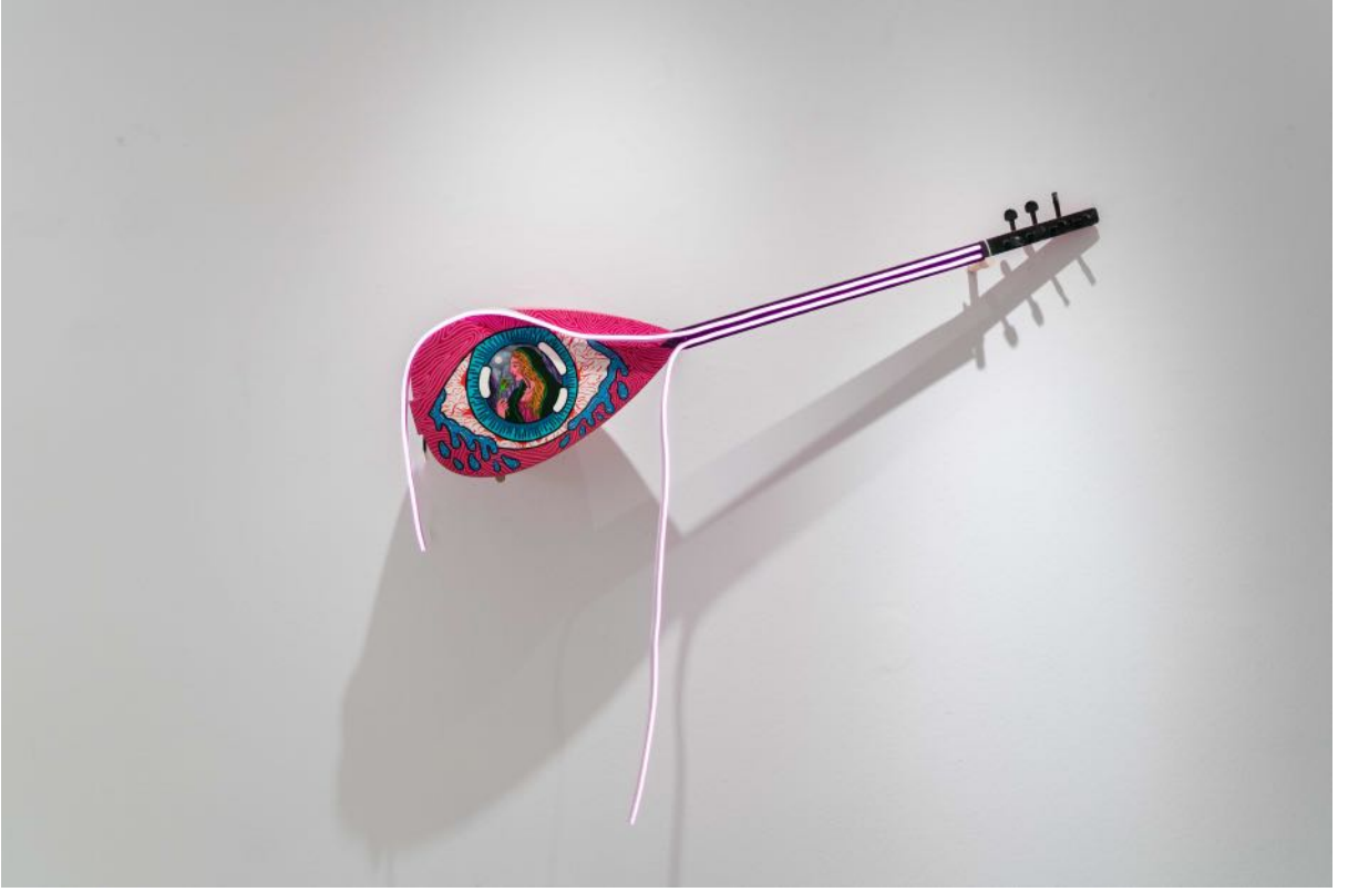
Artık sazım bađrım olur, 2024 pembe led, saz, akrilik pink led, saz, acrylic 75 x 112 x 30 cm