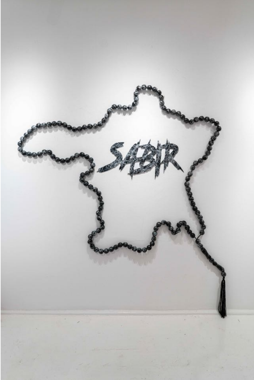
Sabır, 2024 ahşap üzerine karışık teknik mixed media on wood 200 x 175 x 5 cm