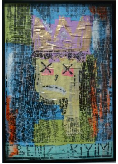
Ebe 1-2-3, 2024 post-it notlar üzerine karışık teknik mixed media on post-it notes 104 x 73 cm