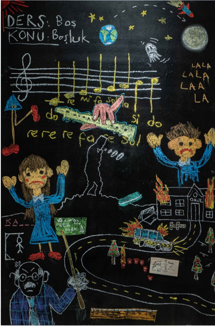
Benimsin, 2024 ahşap, tebeşir, yağlı boya wood, chalk, oil painting 150 x 100 cm