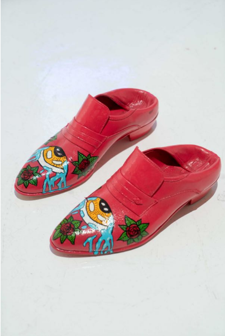
Rahmetli Dayım, 2024 43 numara ayakkabı üzerine karışık teknik mixed media on size 43