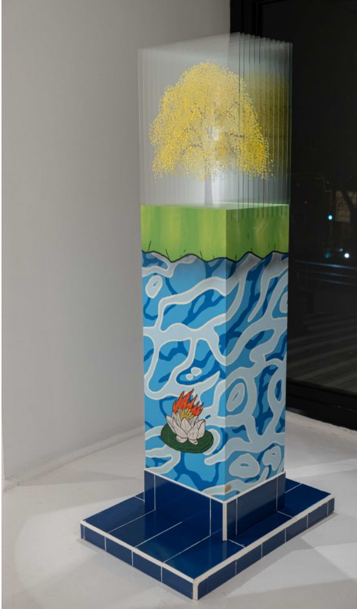
Dilek ağacı, 2024 ahşap kaide, cam, oje, sprej boya, akrilik wooden pedestal, glass, nail polish, spray paint, acrylic 154 x 52 x 70 cm