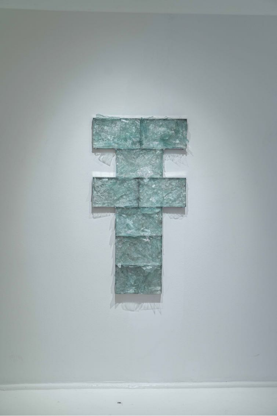
Sek sek, 2024 alüminyum, cam, epoksi aluminium, glass, epoxy 125 x 65 x 8 cm