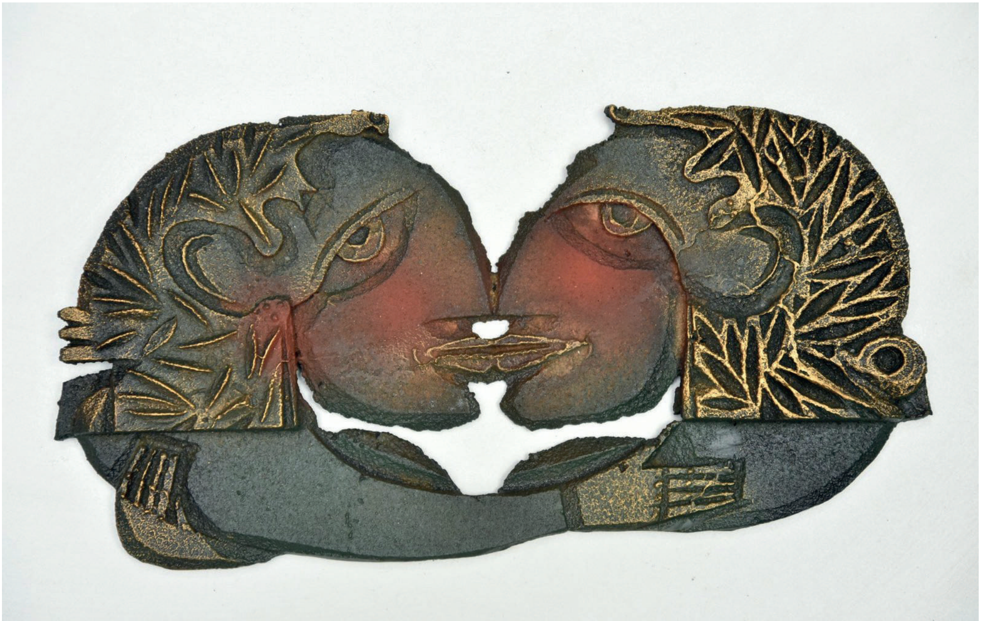
Kisstir Et, 2017 pik döküm, 30 x 15 cm