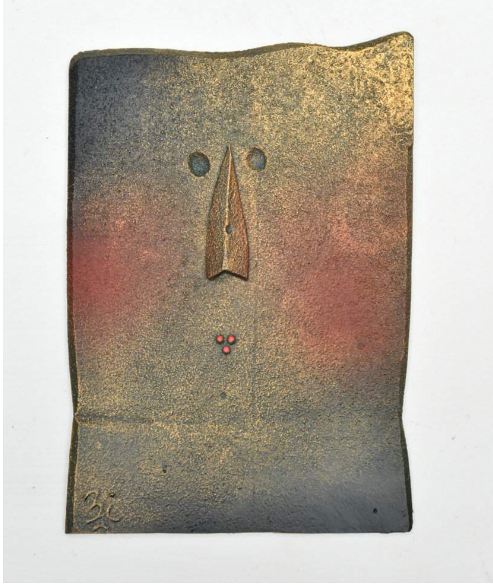
Kikladlı Kadın, 2017 pik döküm, 13 x 18 cm