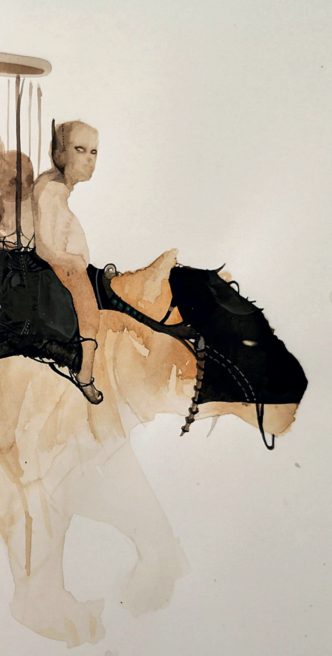
İsimsiz Untitled , 2018 kağıt üzeri suluboya watercolor on paper 35 x 50 cm