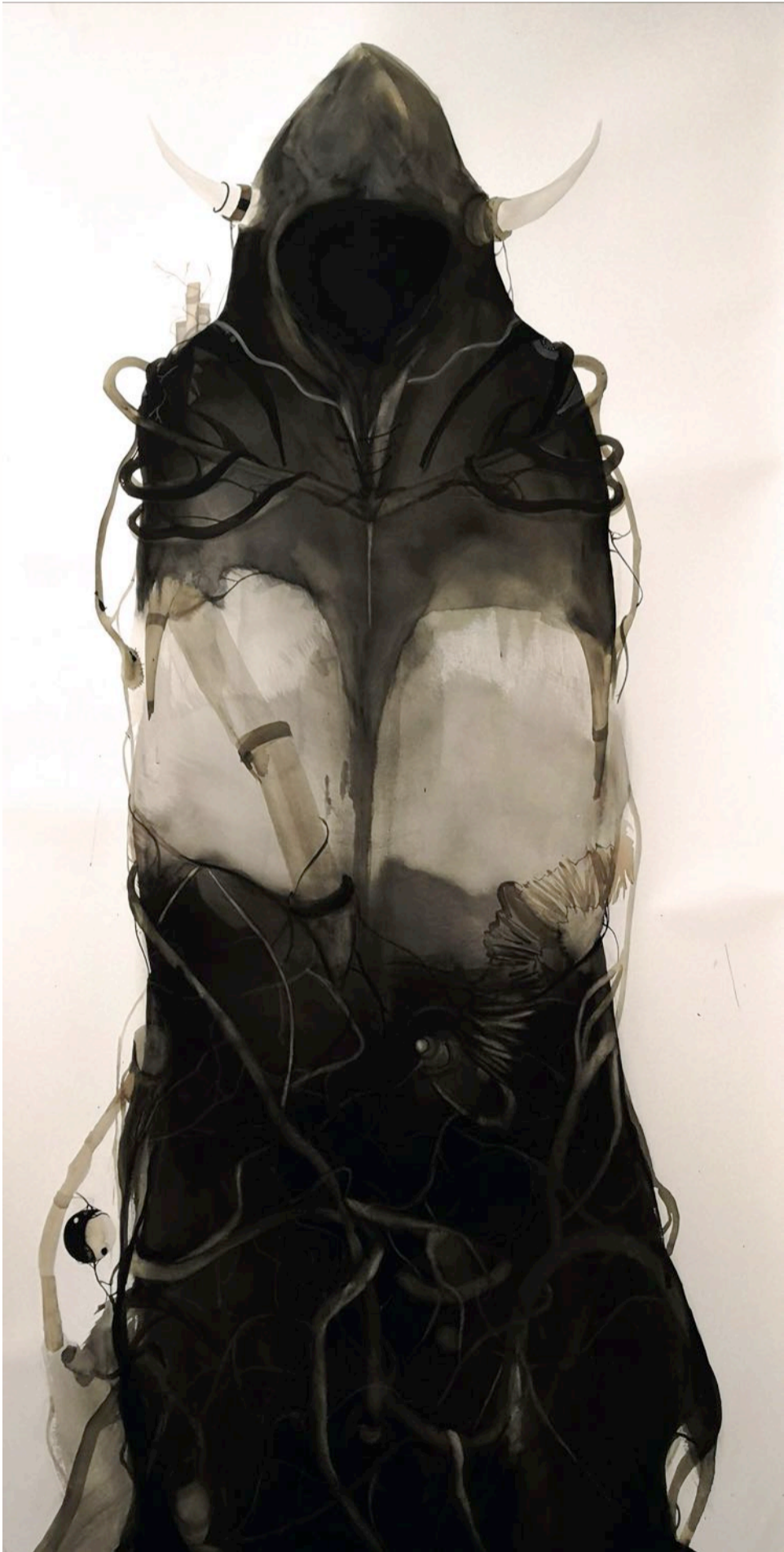
İsimsiz Untitled , 2018 tuval üzeri suluboya watercolor on canvas 80 x 140 cm