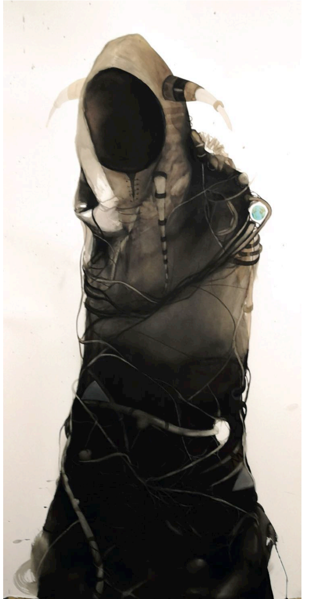
İsimsiz Untitled , 2018 tuval üzeri suluboya watercolor on canvas 80 x 140 cm