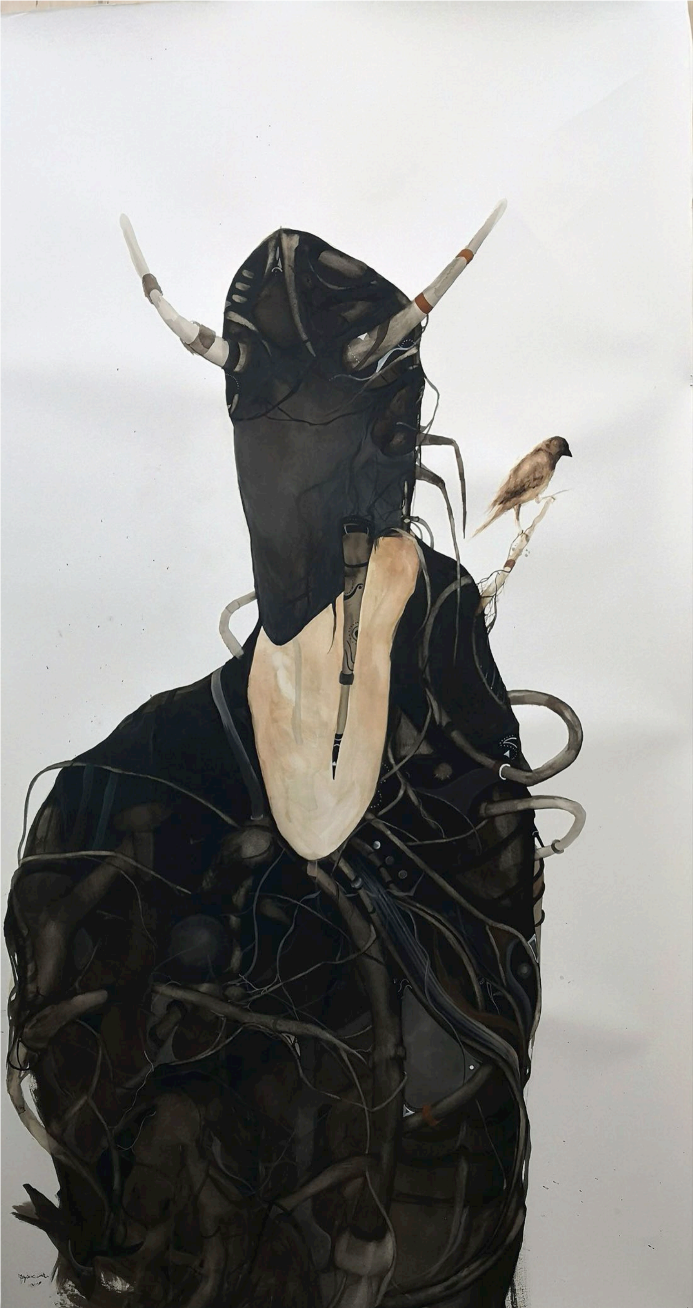
İsimsiz Untitled, 2018 kağıt üzeri suluboya watercolor on paper 80 x 140 cm