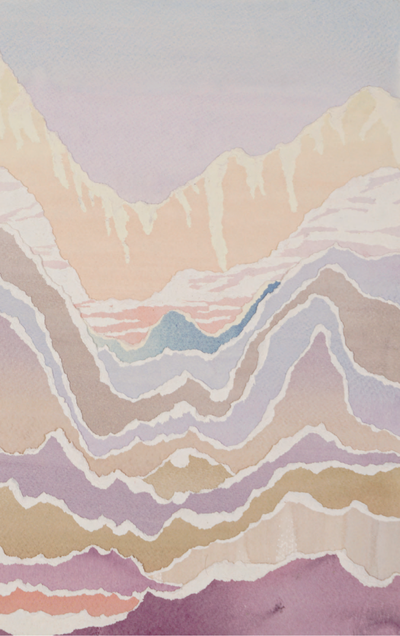
S.S.S, 2018 elle kesilmiş kağıt üzerine suluboya watercolor on hand cut paper 35 x 44 cm