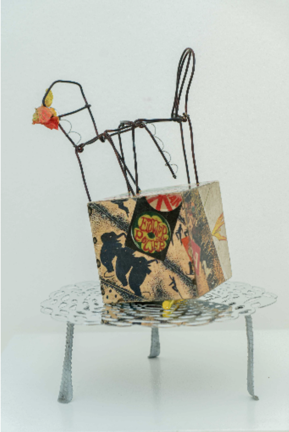
Flower Power, 2023 ahşap, akrilik, 925A gümüş, orkide, demir, pleksi, bakır wood, acrylic, 925K silver, orchid, copper, plexy, iron h. 43 cm