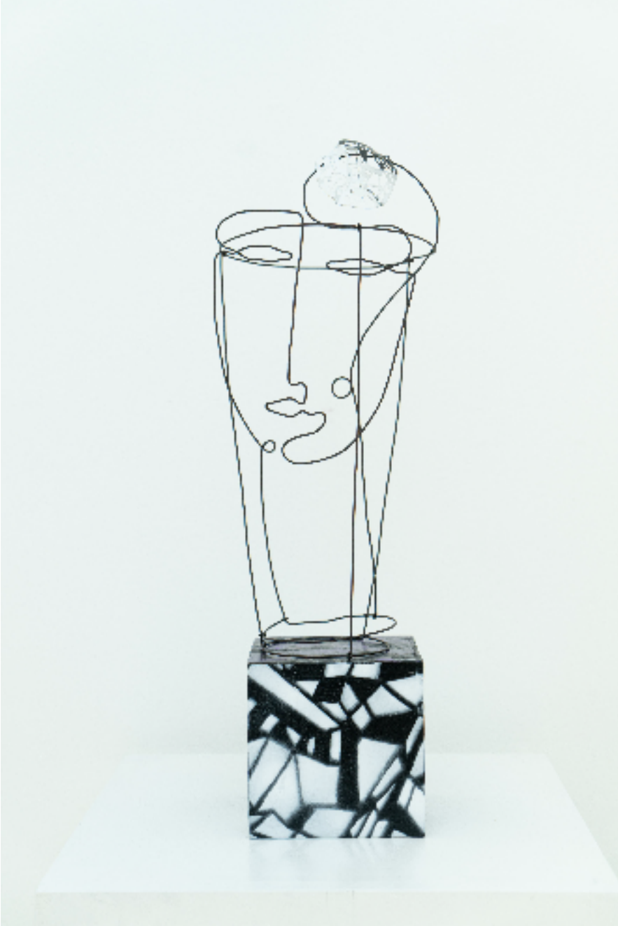
Büst Büst , 2023 ağşap, akrilik, demir, 925A gümüş wood, acrylic, iron, 925K silver h. 62 cm