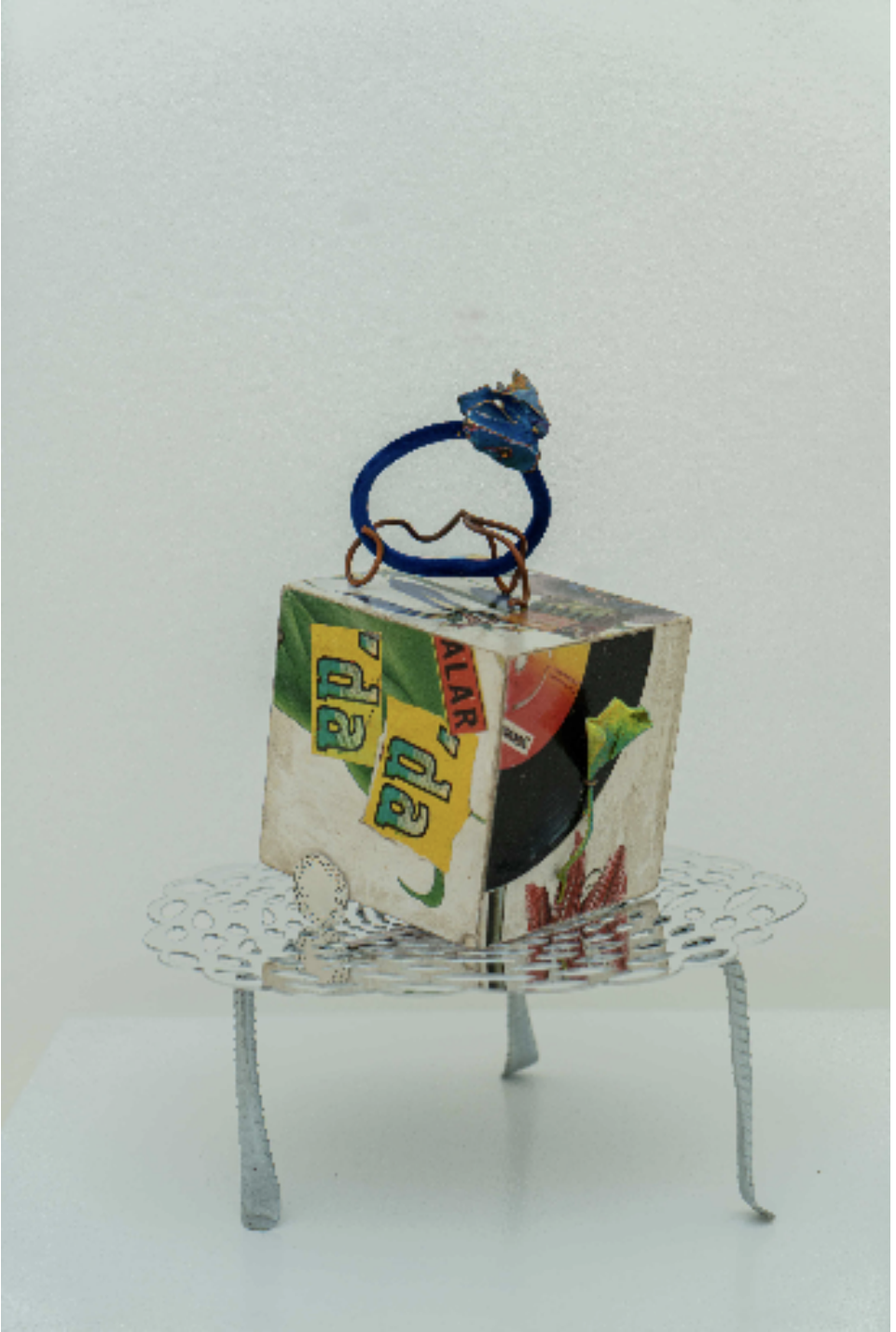
Birdenbire Out Of The Blue , 2023

ahşap, akrilik, 925A gümüş, orkide, bakır, pleksi, demir, alüminyum, inci wood, acrylic, 925A silver, orchid, iron, aluminum, copper, plexy, pearl h. 33 cm