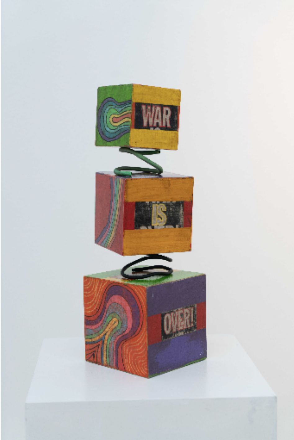
War Is Over, 2021 ahşap üzerine akrilik ve kolaj acrylic and collage on wood 47 x 15 x 15 cm