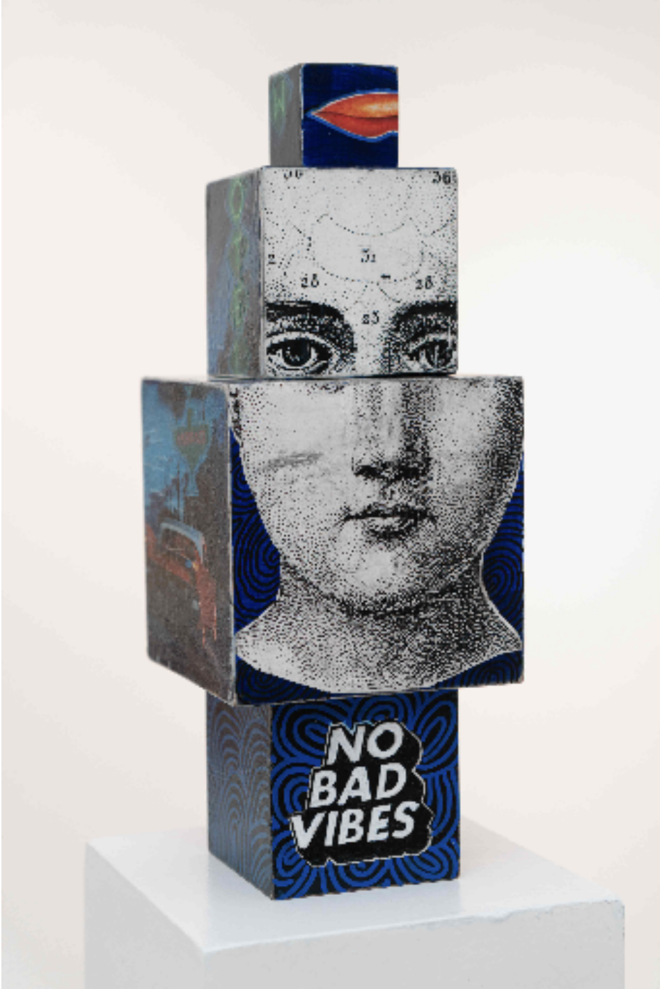
No Bad Vibes, 2022 aħşap ¼zerine akrilik ve kolaj acrylic and collage on wood 40 x 15 x 15 cm