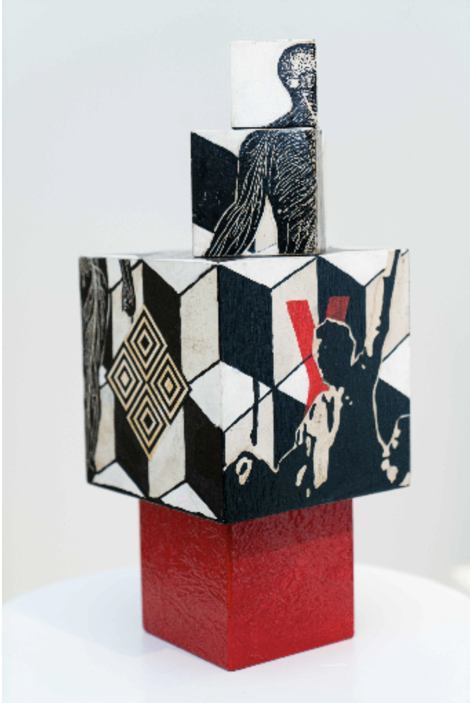
Meçhul Öğrenci Anonymous Student , 2022 ağşap üzerine akrilik ve kolaj acrylic and collage on wood 38 x 30 x 15 cm