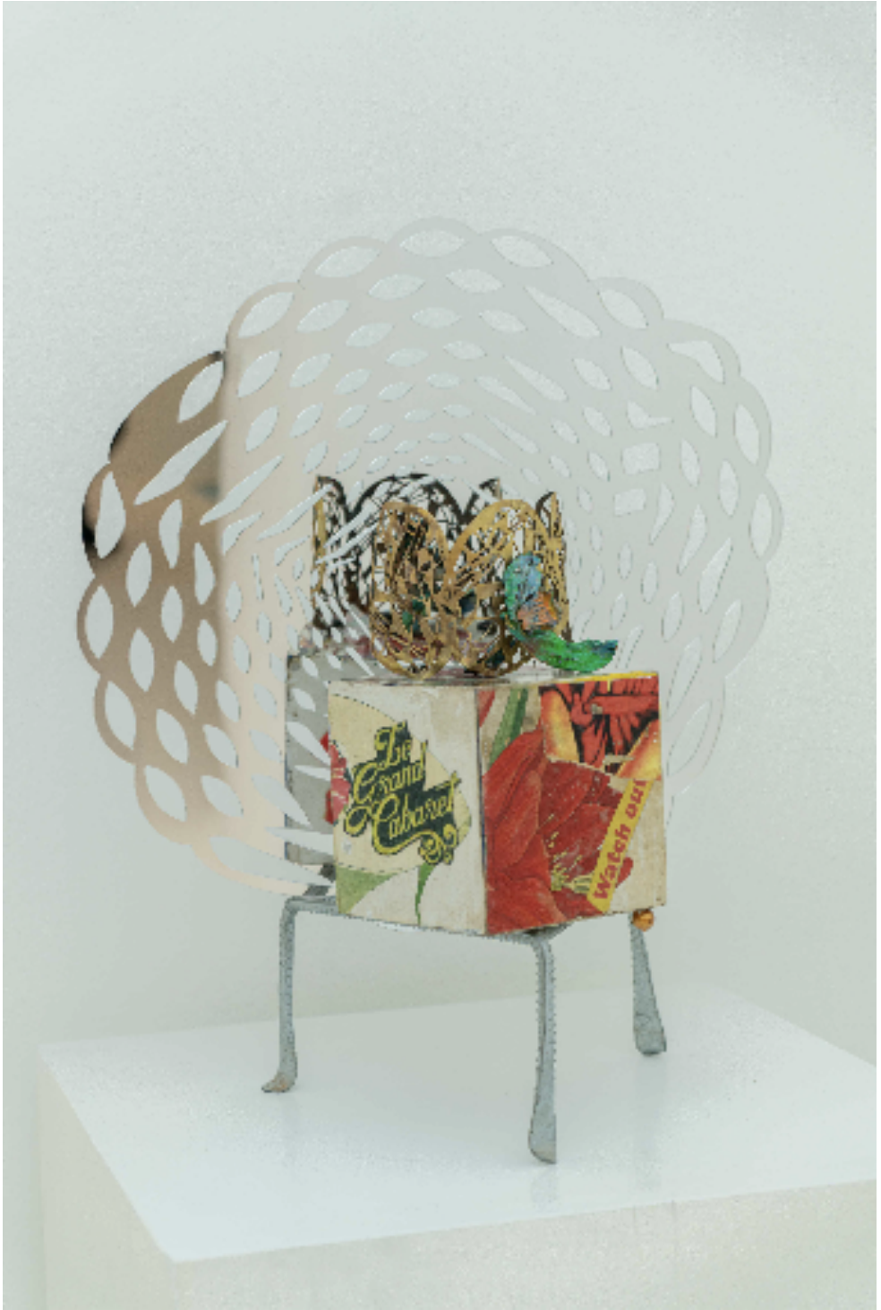
Le Grand Cabaret, 2023

ahşap, akrilik, piring, 925A gümüş, pleksi, demir, orkide wood, acrylic, brass, 925K silver, plexy, iron, orchid h. 49 cm