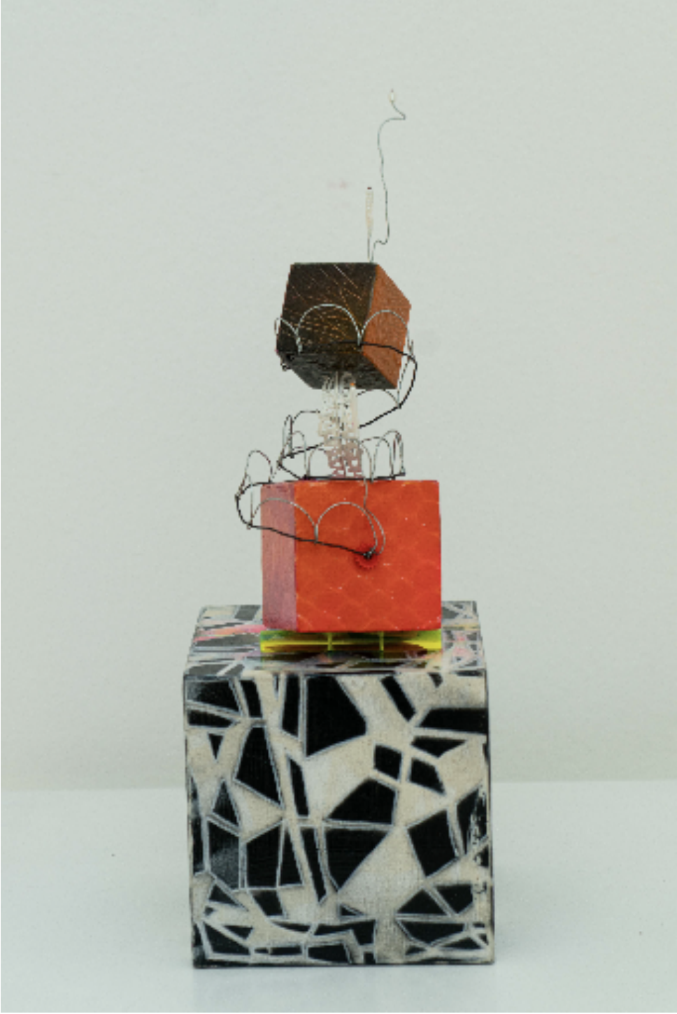
Çok Ama Çok Seviyorum, 2023 ahşap, akrilik, 925K gümüş, inci, pleksi wood, acrylic, iron, 925A silver, plexy, pearl h. 43 cm