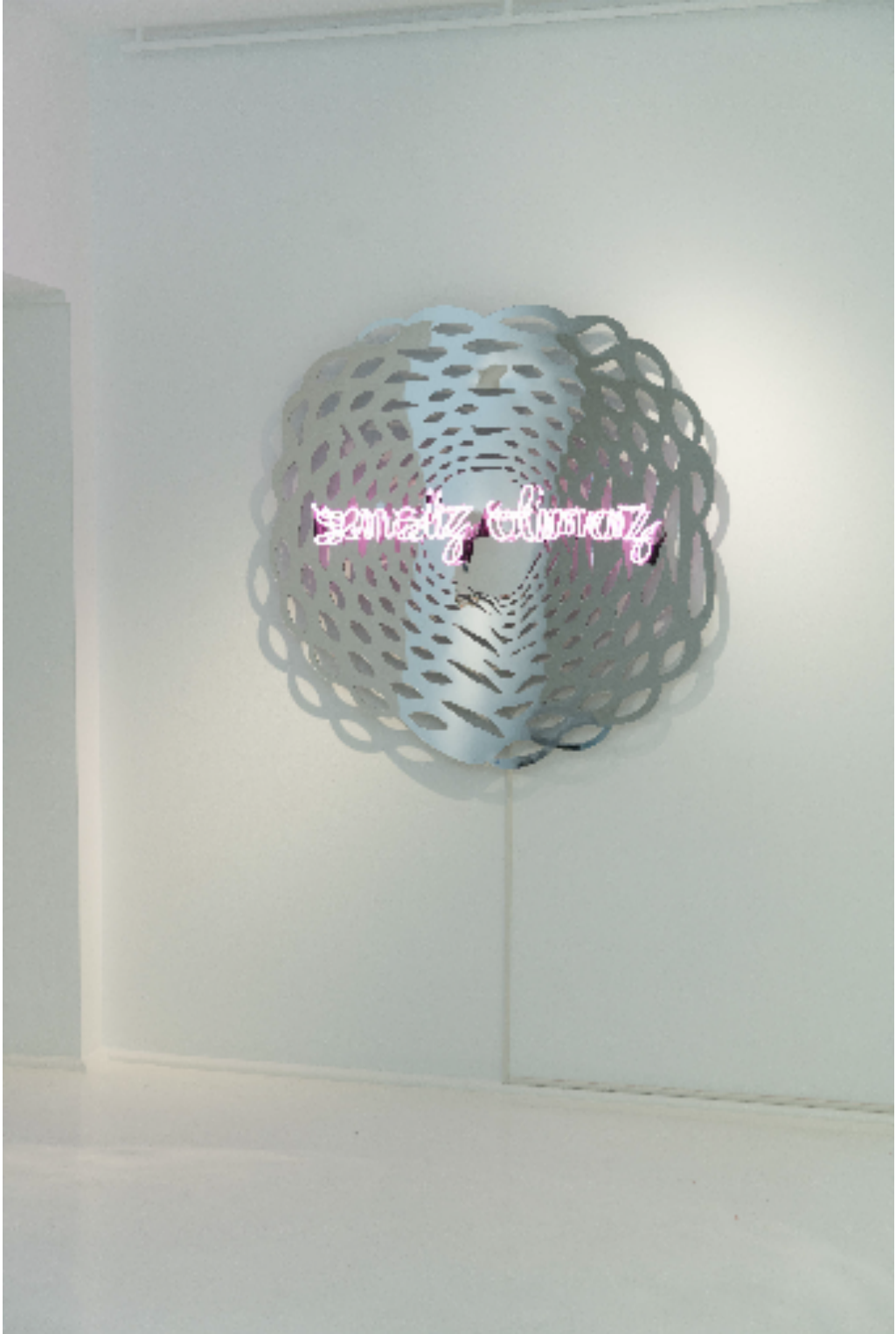
Sensiz Olmaz, 2023 neon, pleksi neon plexy 118 x 118 x 9 cm