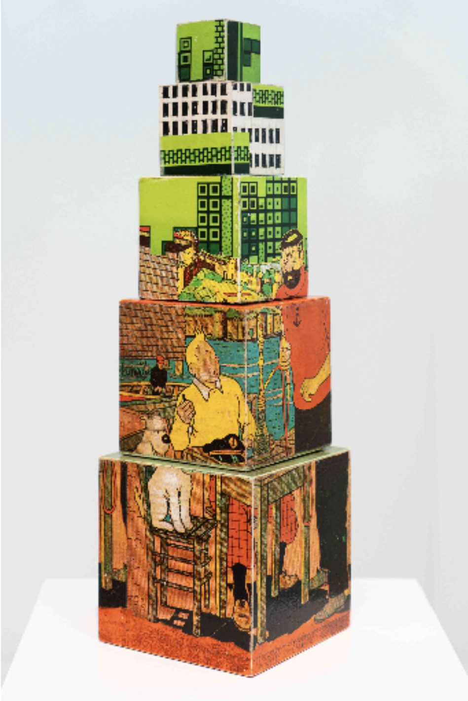
Level 7 / Tenten TetriSTANBULDA, 2021 aħşap ¼zerine akrilik ve kolaj acrylic and collage on wood 50 x 15 x 15 cm