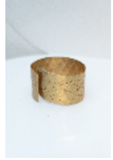
Karalamalar Doodles , 2023