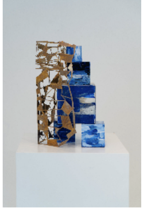
Karalama I-II Doodle I-II, 2023 aħşap ¼zerine akrilik boya, piriñç acrylic on wood, brass h. 35 cm - h 43 cm