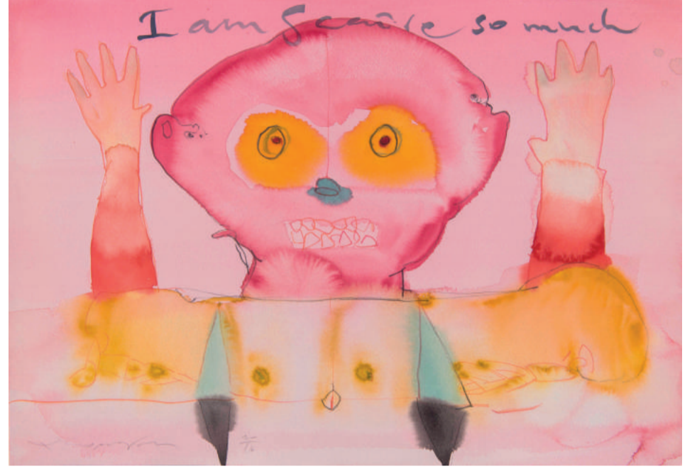
İsimsiz Untitled, 2016 - 2018 kağıt üzerine mürekkep ve suluboya watercolor and ink on paper 65 x 50 cm