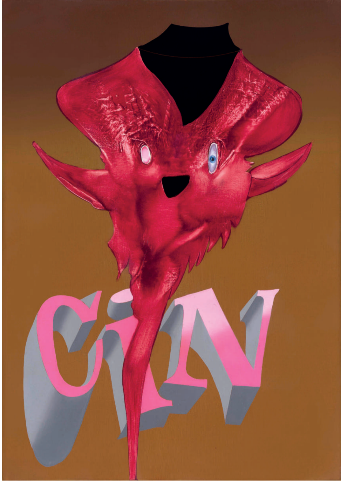
İsimsiz Untitled , 2018 tuval üzerine yağlıboya oil on canvas 60 x 80 cm