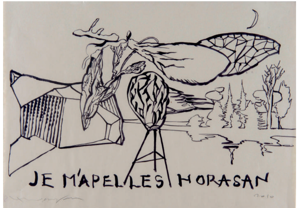
İsimsiz Untitled, 2010 kağıt üzerine mürekkep ink on paper 55 x 43 cm

I do not want to treat the figure here by blessing human solely. I do not want to see a body as a body in Greek mythology. I want to see that body within all the living creatures. That's why; everything in that body, added to it, augmenting or diminishing in it, more than a grotesque attitude, is in fact a state of being all at one. This is my real concern. We always iconize the human. In fact, rather the human we iconize the beautiful human being, and the social order today is already pointing out this. Everything is about to be a beautiful person, fit bodies, beautiful faces are all emphasizing beauty. We are always in a state that should evolve into that direction constantly. Therefore, we are very much into consumption. Today the products of the world's beauty industry and the position of the textile industry all are relevant to our