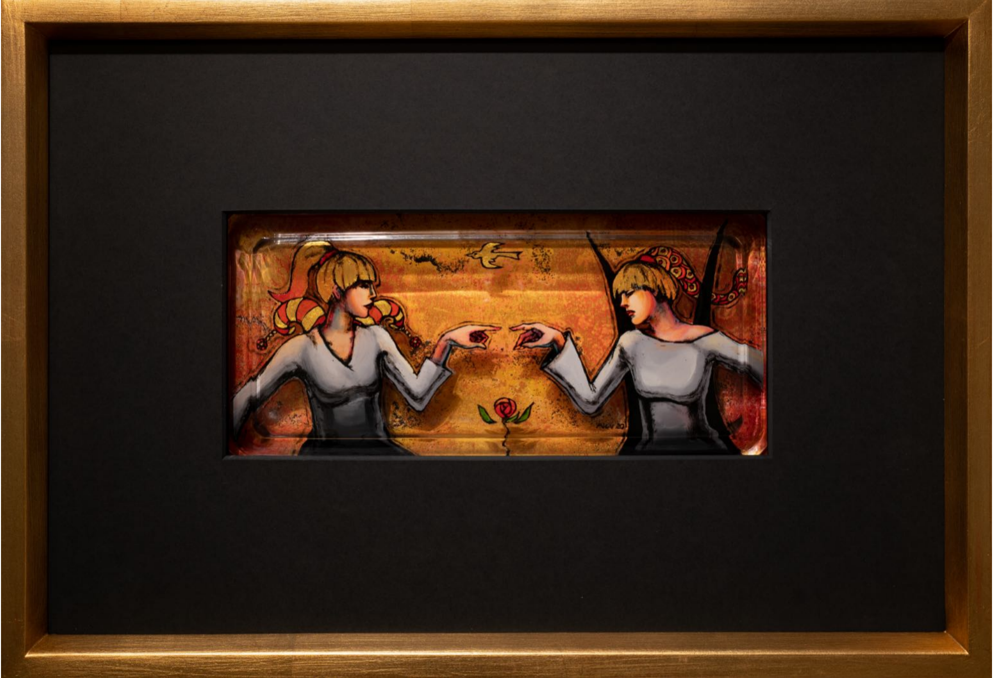
Karşılaşmalar Serisi - Sakince Encountering Series - Calmly , 2020 cam altı reverse glass 39 x 54 cm