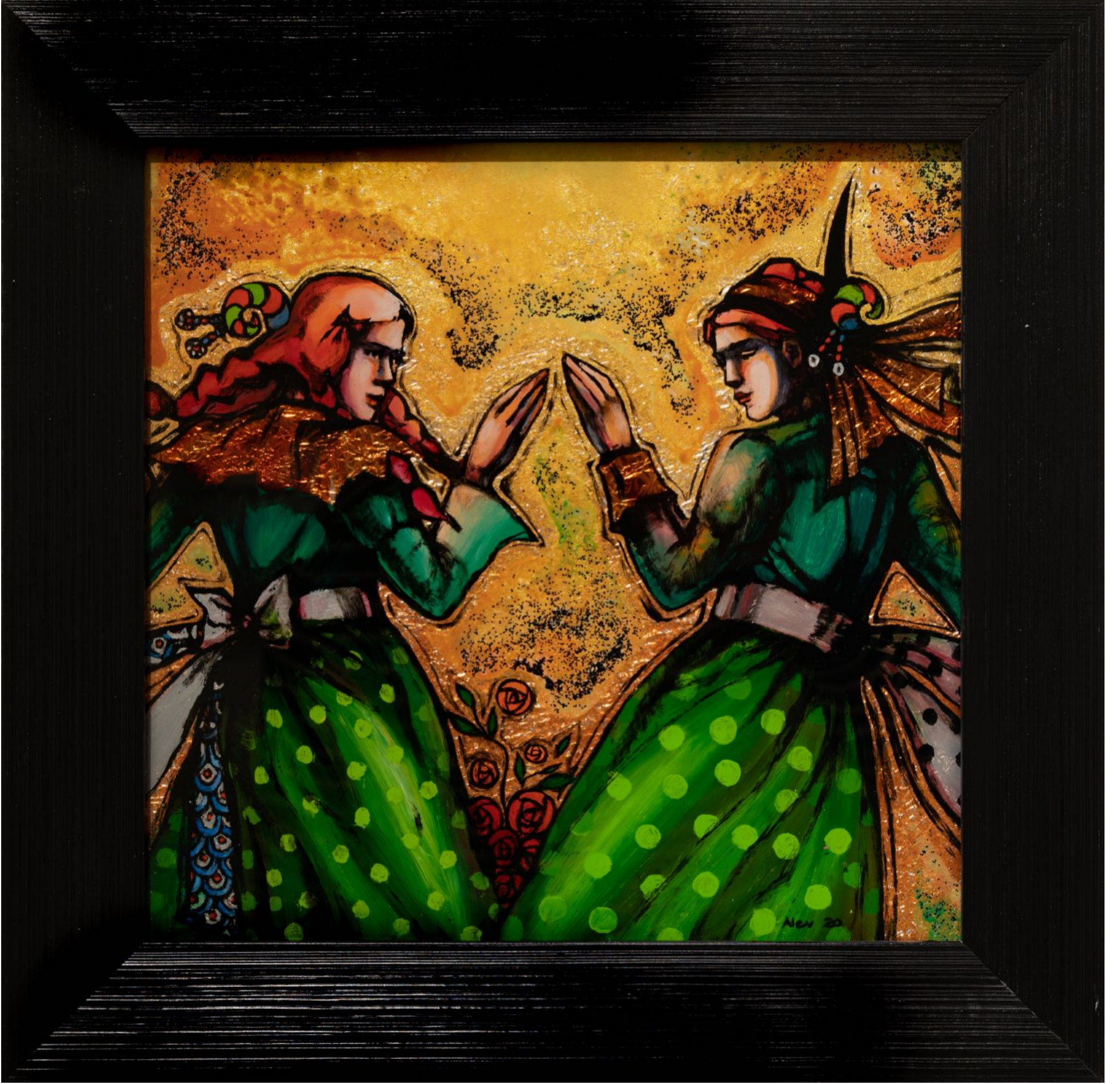
Yeşil - Yeşil Green - Green, 2020 cam altı reverse glass 25 x 25 cm