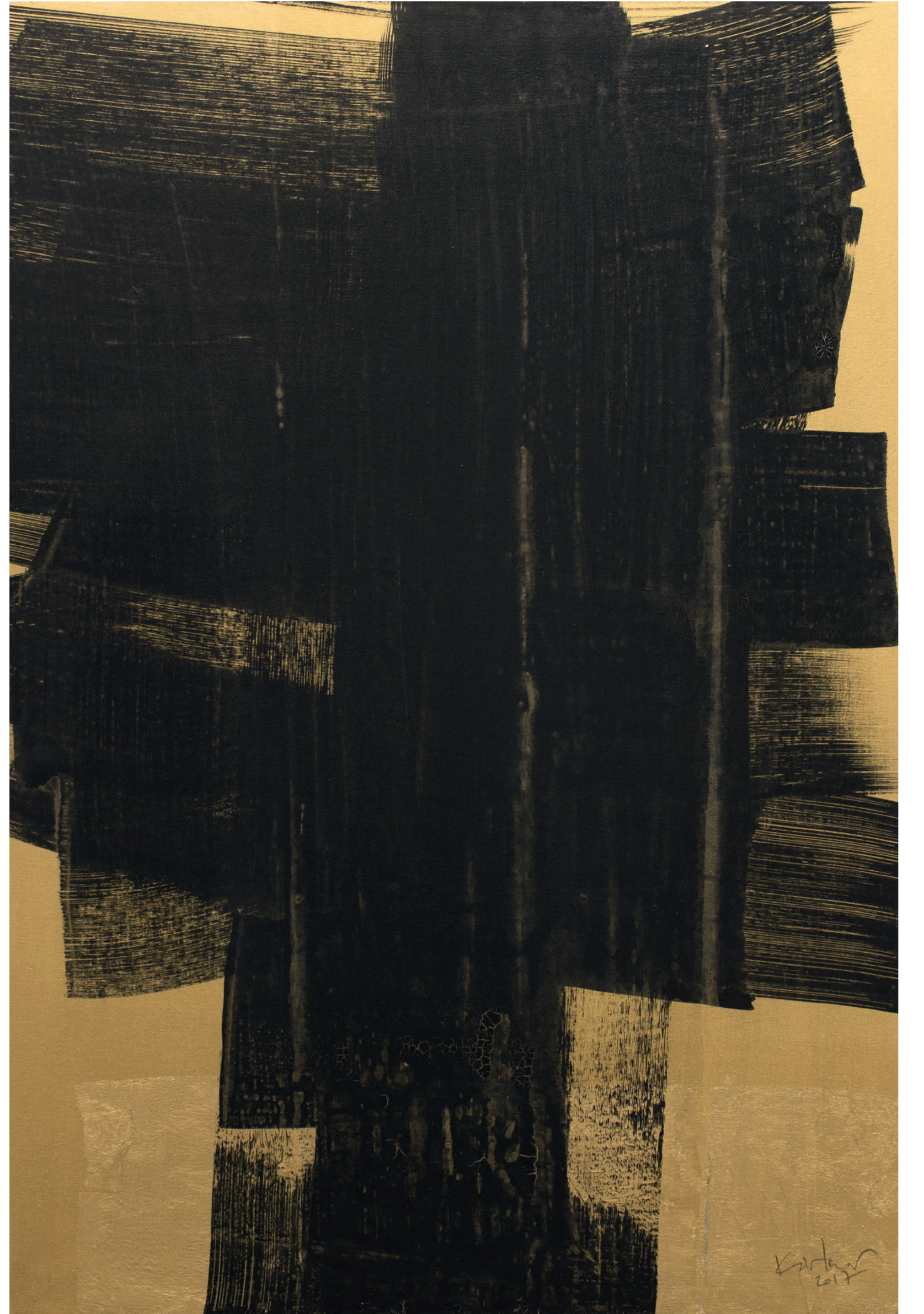
İsimsiz/Untitled, 2017 tuval üzerine hint su boyası + akrilik ve altın varak / indian water paint + acrylic and gold leaf on canvas 85,5 X 62 cm.