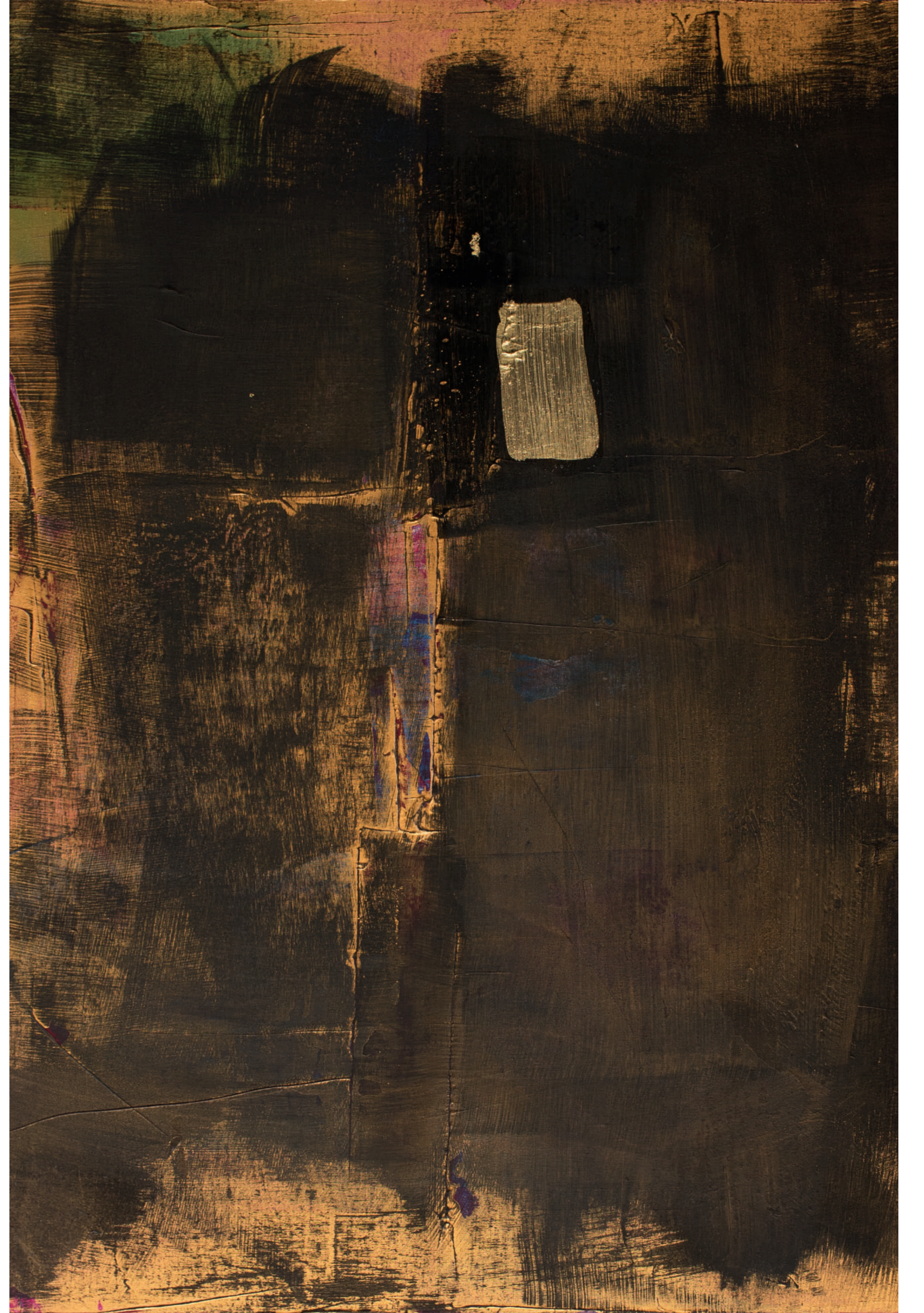
İsimsiz/Untitled, 2017 tuval üzerine karışık teknik ve altın varak / mixed media and gold leaf on canvas 85,5 X 62 cm.

Concepts as “opposite” as black and white, cold and hot, conscious and subconscious, planned and coincidental, adapting casually with confidence to form a wonderful combination resulting in a synthesis.