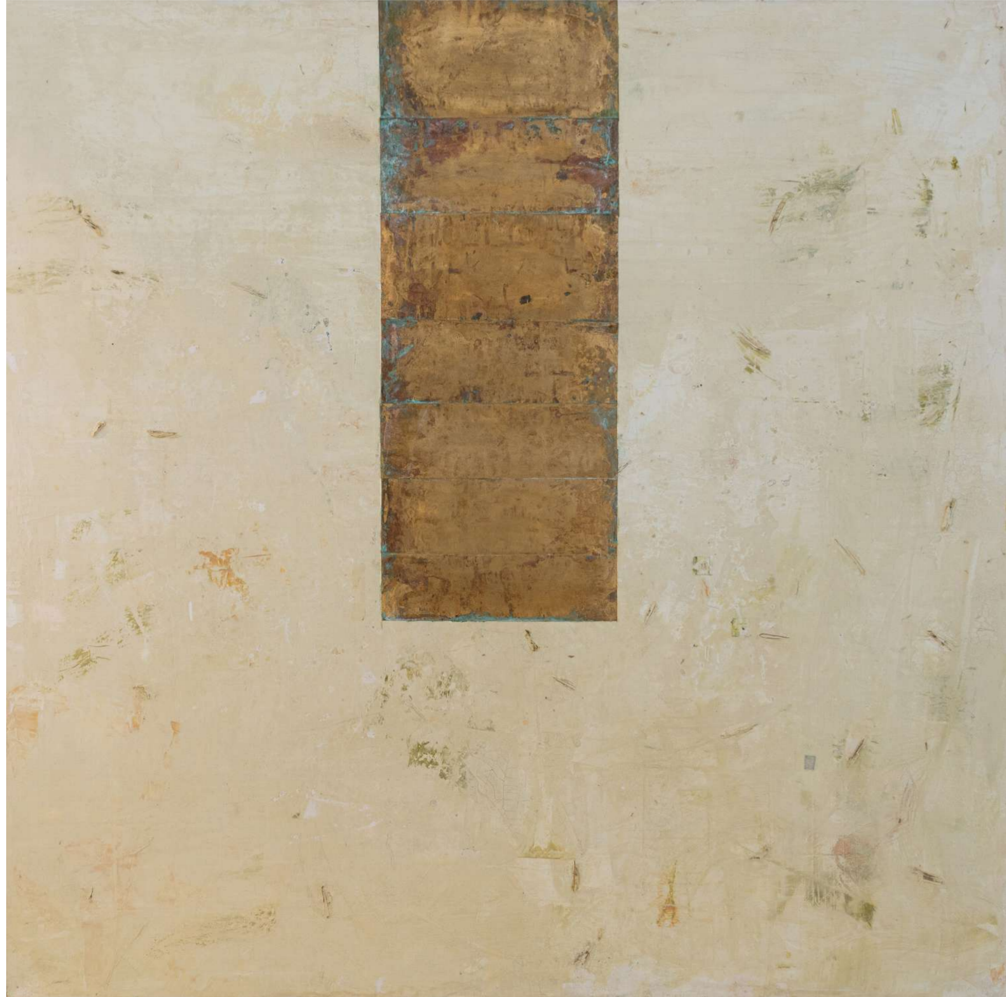
İsimsiz/Untitled, 2021 tuval üzerine karışık teknik / mixed media on canvas 150 X 150 cm.