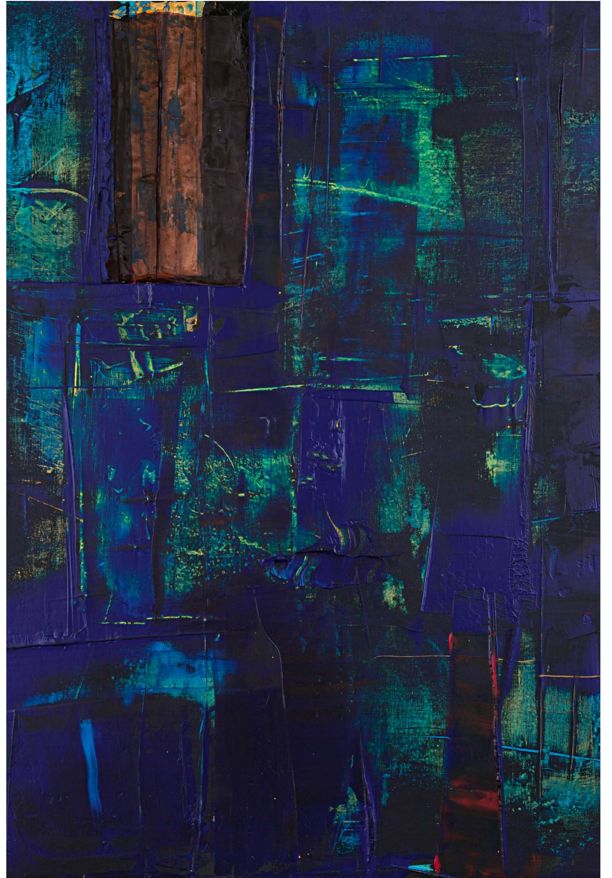
İsimsiz/Untitled, 2018 tuval üzerine karışık teknik / mixed media on canvas 85,5 X 62 cm.

While Opposite reflects my lifestyle, on one hand, it comes together with the name Siyah Beyaz, on the other hand. ■