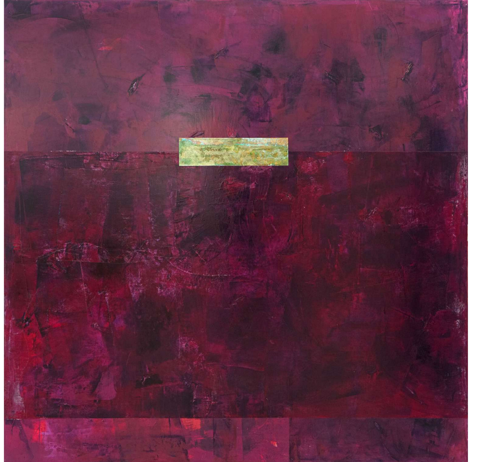
İsimsiz/Untitled, 2021 tuval üzerine karışık teknik / mixed media on canvas 150 X 150 cm.