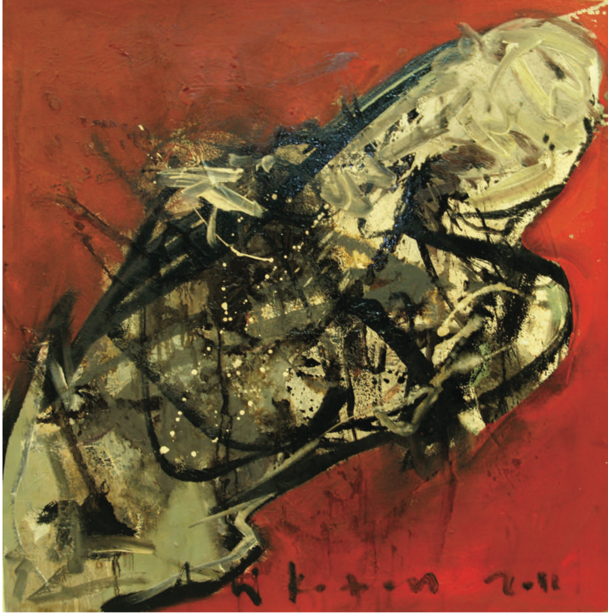
İSİMSİZ UNTITLED, 2012 TUVAL ÜZERİ YAĞLIBOYA OIL PAINTING ON CANVAS, 100 x 100 cm