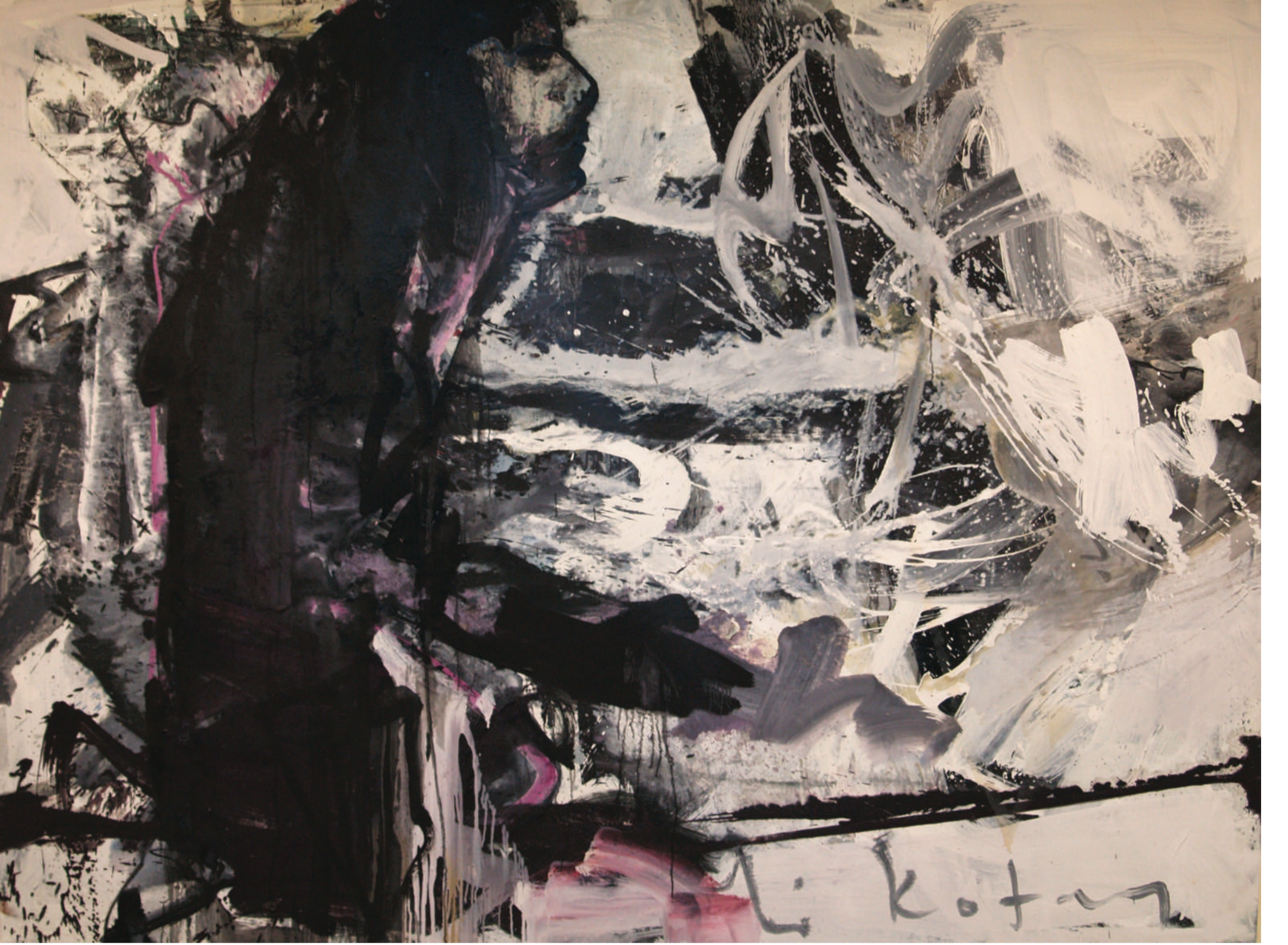
İSİMSİZ UNTITLED, 2012 TUVAL ÜZERİ YAĞLIBOYA OIL PAINTING ON CANVAS, 200 x 150 cm