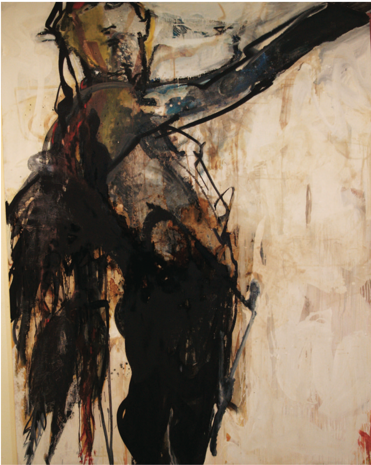
iSİMSİZ UNTITLED, 2012 TUVAL ÜZERİ YAĞLIBOYA OIL PAINTING ON CANVAS, 150 x 190 cm

WHEN THE WRATH OF TIME SPEEDS DOWN UPON US... WHEN THE MOANS, MUTTERINGS AND AVOIDANCES IMPRISON US AT A TIME WHEN THE DARKNESS HUNKERING UPON US MORE AND MORE EVERY HAS ISOLATED US WITH ALL ITS MIGHT, OUR REACTIONS SLOW DOWN, OUR THOUGHTS BECOME MUDDLED.