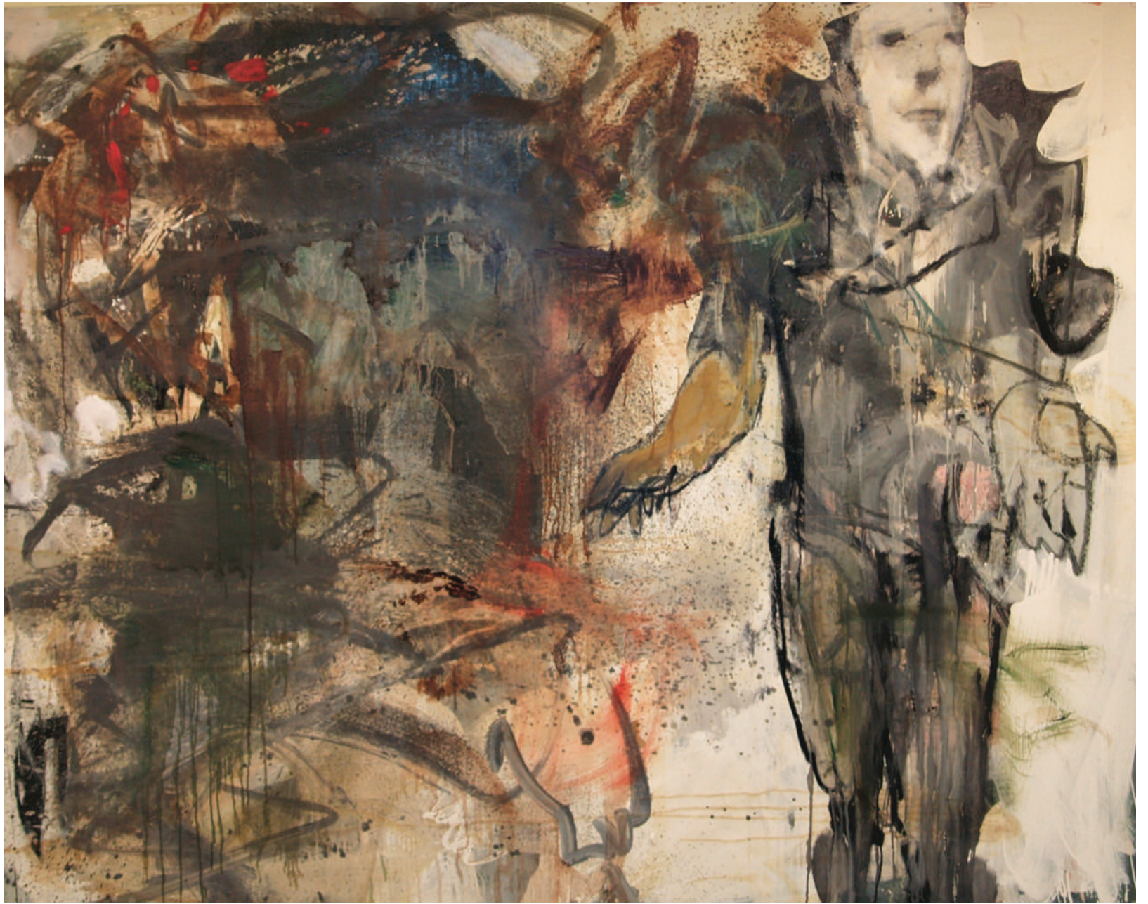
İSİMSİZ UNTITLED, 2012 TUVAL ÜZERİ YAĞLIBOYA OIL PAINTING ON CANVAS, 170 x 160 cm

HIZLANARAK YAKLAŞTIĞINDA ZAMANIN KIZGINLIĞI... İNİLTİLERİN, MİRINDANMALARIN, KAÇINMALARIN, GÜNBE- GÜN ÜSTÜMÜZE ÇÖREKLENEN KARANLIĞIN, VAR GÜCÜYLE YALNIZLAŞTIRDIĞI BİZLERİ ESİR ALDIĞINDA TEPKİLERİMİZ YAVAŞLAR, DÜŞÜNCELERİMİZ BULANIKLAŞIR.