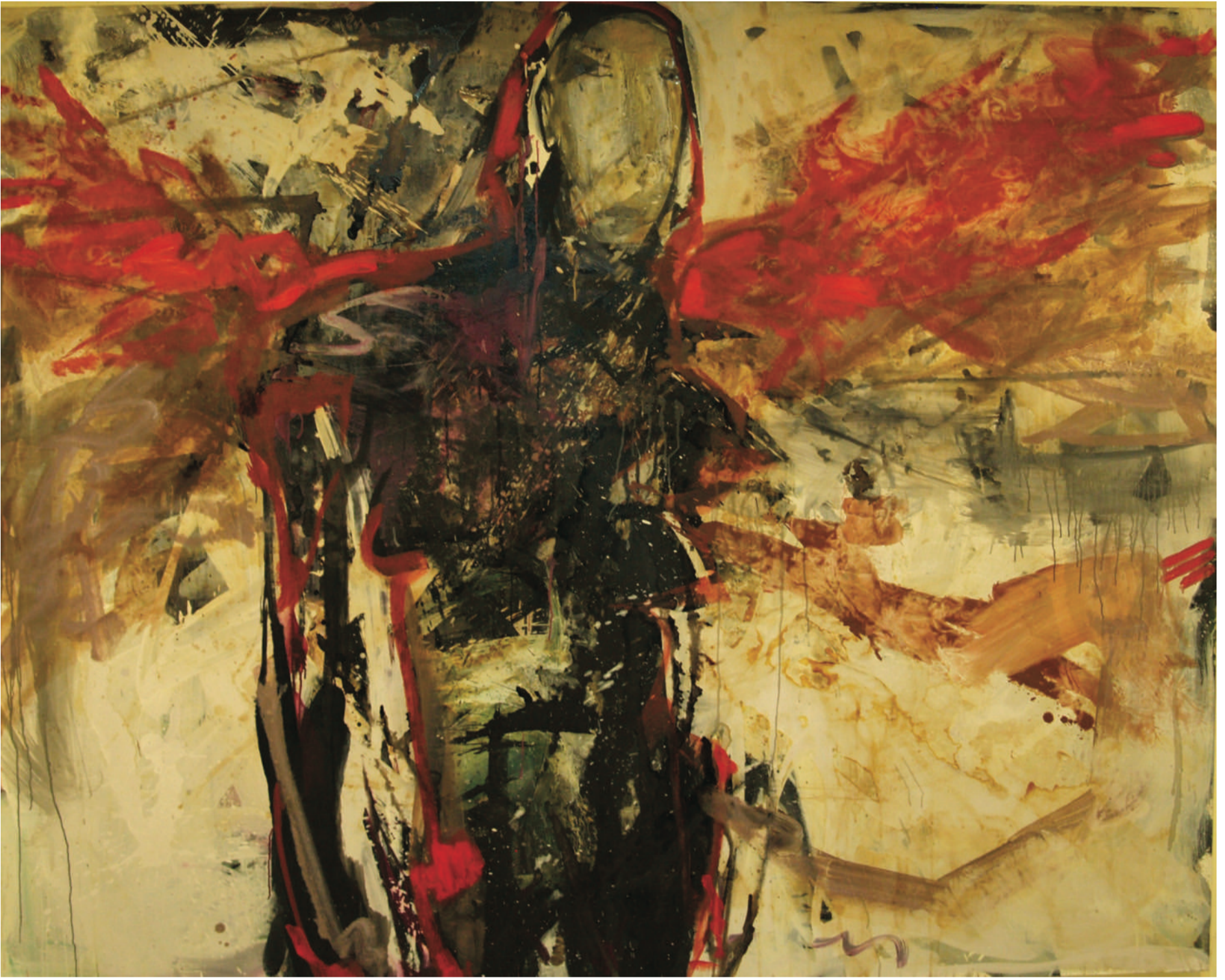
İSİMSİZ UNTITLED, 2012 TUVAL ÜZERİ YAĞLIBOYA OIL PAINTING ON CANVAS, 180 x 150 cm