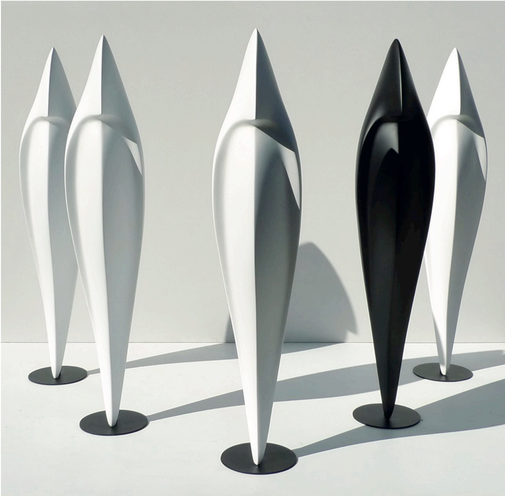
Muhafız Guardians (yerleştirme installation), 2015 polyester döküm üzerine oto boyası, mermer döküm, metal kaide auto paint on polyester casting, marble casting, metal base 12 x 12 x 90 cm adet piece 90 x 70 x 90 cm yerleştirme installation