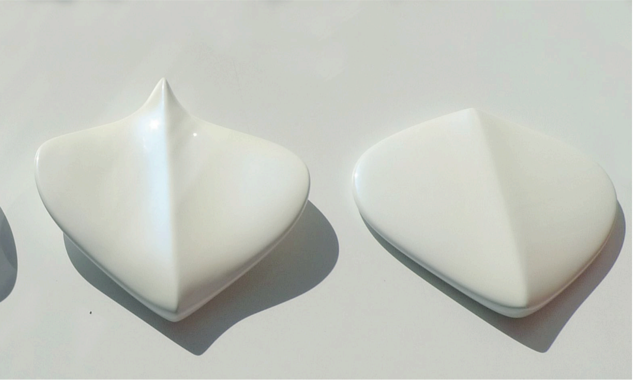
Evrin Evolution (yerleşirme installation), 2016 polyester üzerine sedef boya pearl paint on polyester 180 x 57 x 15 cm