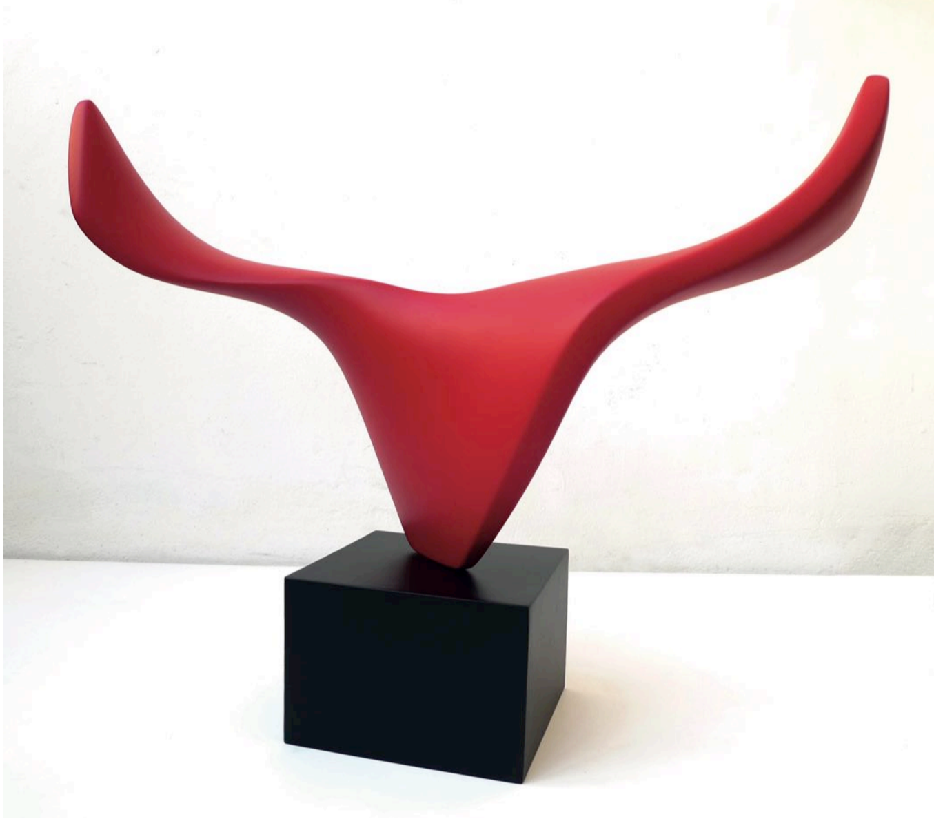
Boğa Bull, 2016 polyester üzerine oto boya auto paint on polyester 85 x 25 x 63 cm