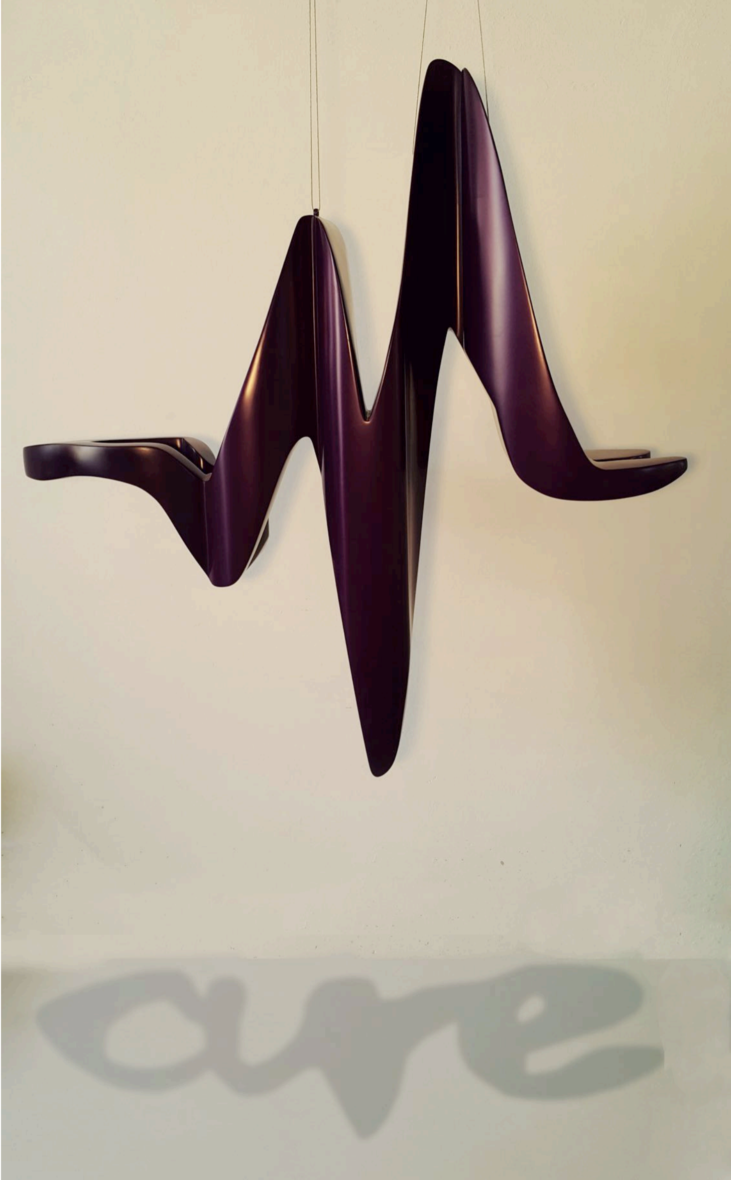
Şifa Cure, 2015 polyester üzerine oto boyası auto paint on polyester 100 x 100 x 30 cm