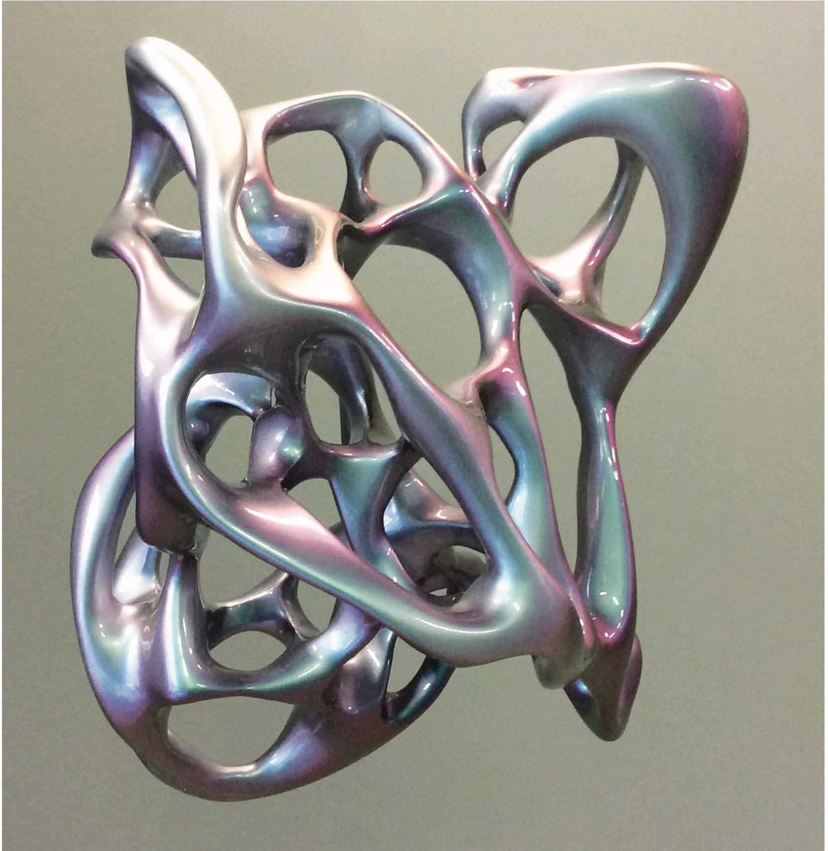
Untitled, 2015 polyester 48 x 48 x 28 cm