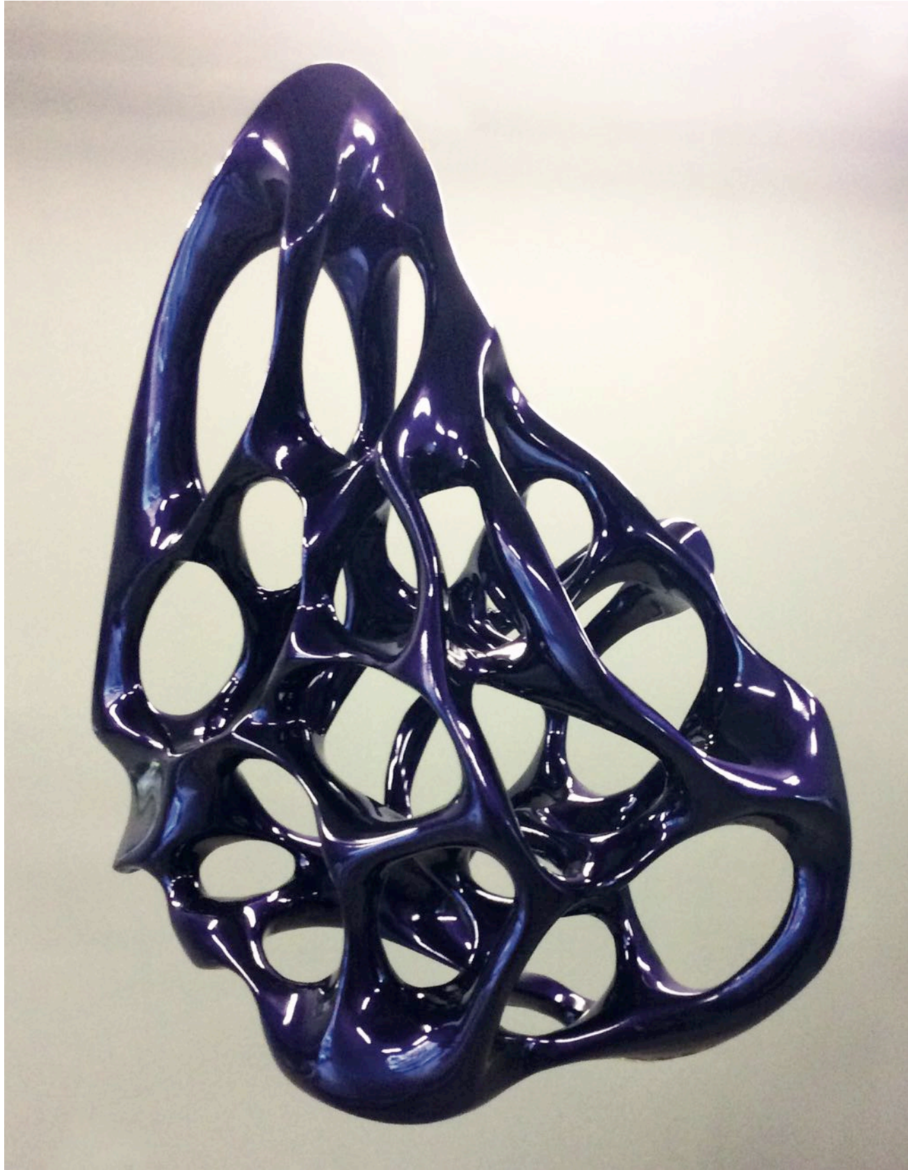
Untitled, 2015 polyester 70 x 73 x 32 cm