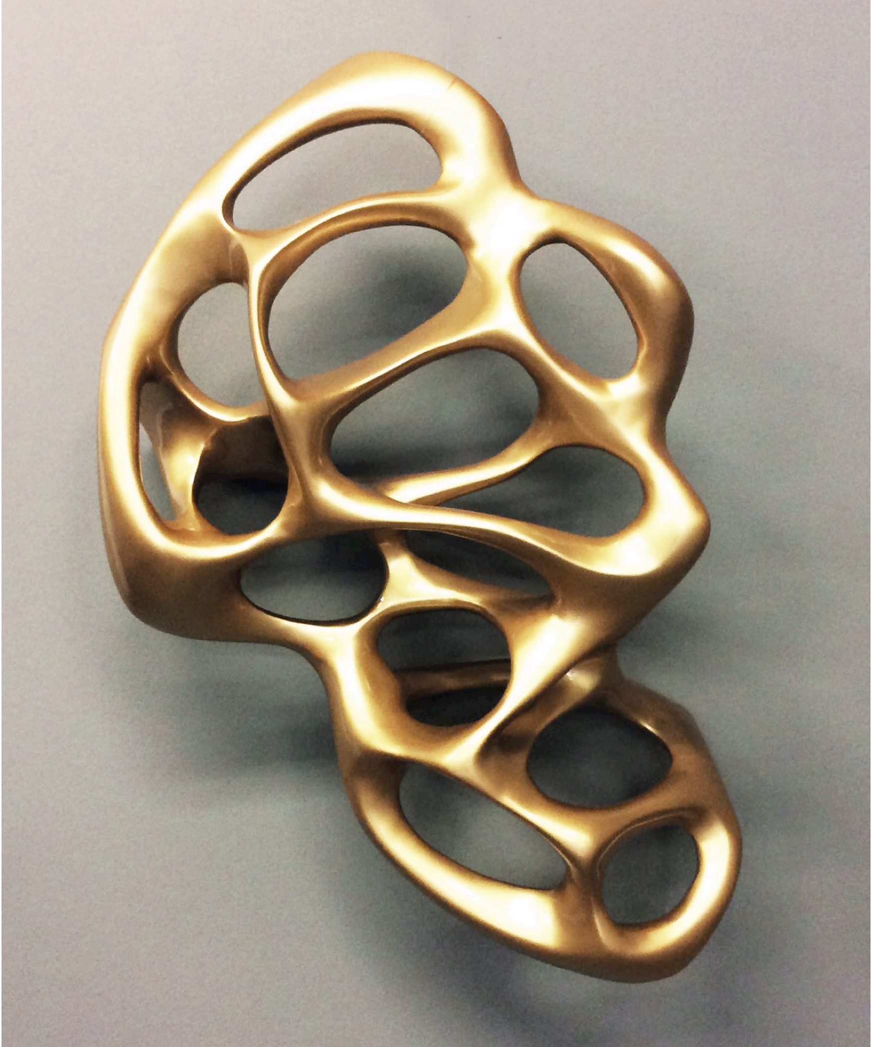
Repressed, 2015 polyester 95 x 92 x 46 cm